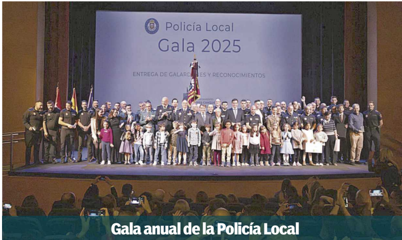
Gala anual de la Policía Local

El equipo de Gobierno ha presentado los presupuestos municipales para el año que viene, que ascienden a 83,9 millones de euros. Un 23,26% más que el ejercicio anterior. El siguiente paso es llevarlos a Pleno para su debate y aprobación inicial. PÁGINA 2.